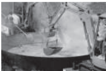
大型重機(バックホー)が大活躍!!

平成元年に始まった山形市で開催される「日本一のいも煮会フェスティバル」では、毎年9月の第一日曜日に里いも3ト、山形牛1.2トで、直径6mの大鍋に約3万食の芋煮が作られ、調理の際には巨大な鍋に対処して大型重機が用いられます。20周年の今年はなんと5万食が準備されるそうです。